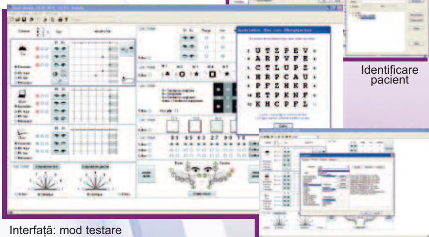
Interfață: mod testare